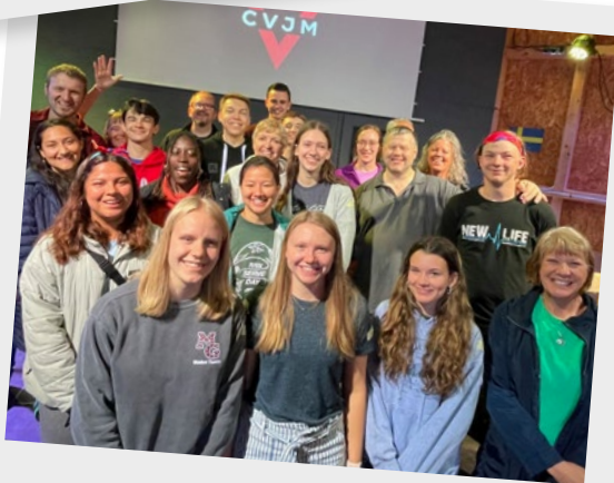
Team International Camp